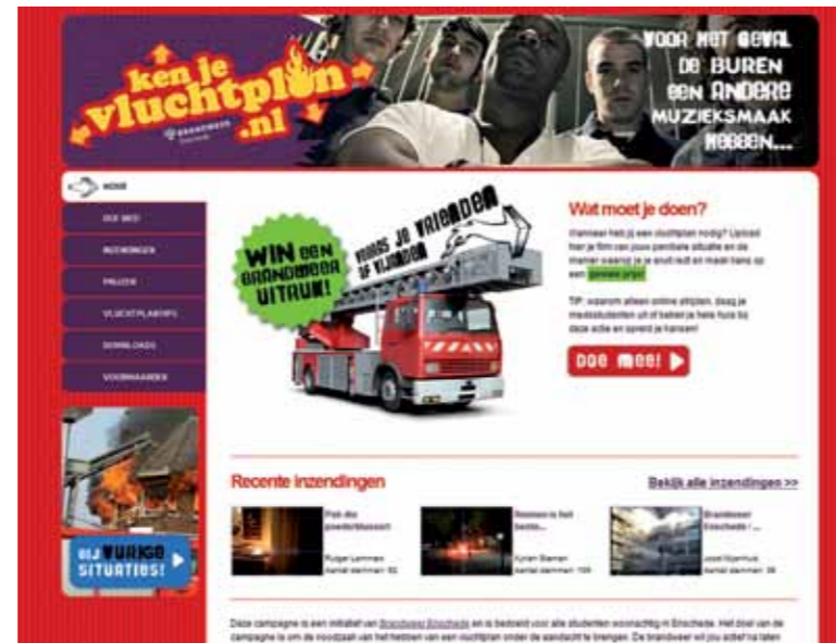
Brandweer Enschede voert campagne om het veiligheidsbewustzijn en de zelfredzaamheid van studenten in Enschede te vergroten.

Je hoeft het wiel niet opnieuw uit te vinden. Ga vooral eens winkelen bij anderen. De verkregen informatie zal je zeker ook behoeden voor fouten die zij gemaakt hebben. Benader de organisaties zelf, zoek op internet naar informatie of doe een beknopte literatuurstudie. Beschrijf je bevindingen in je projectplan.